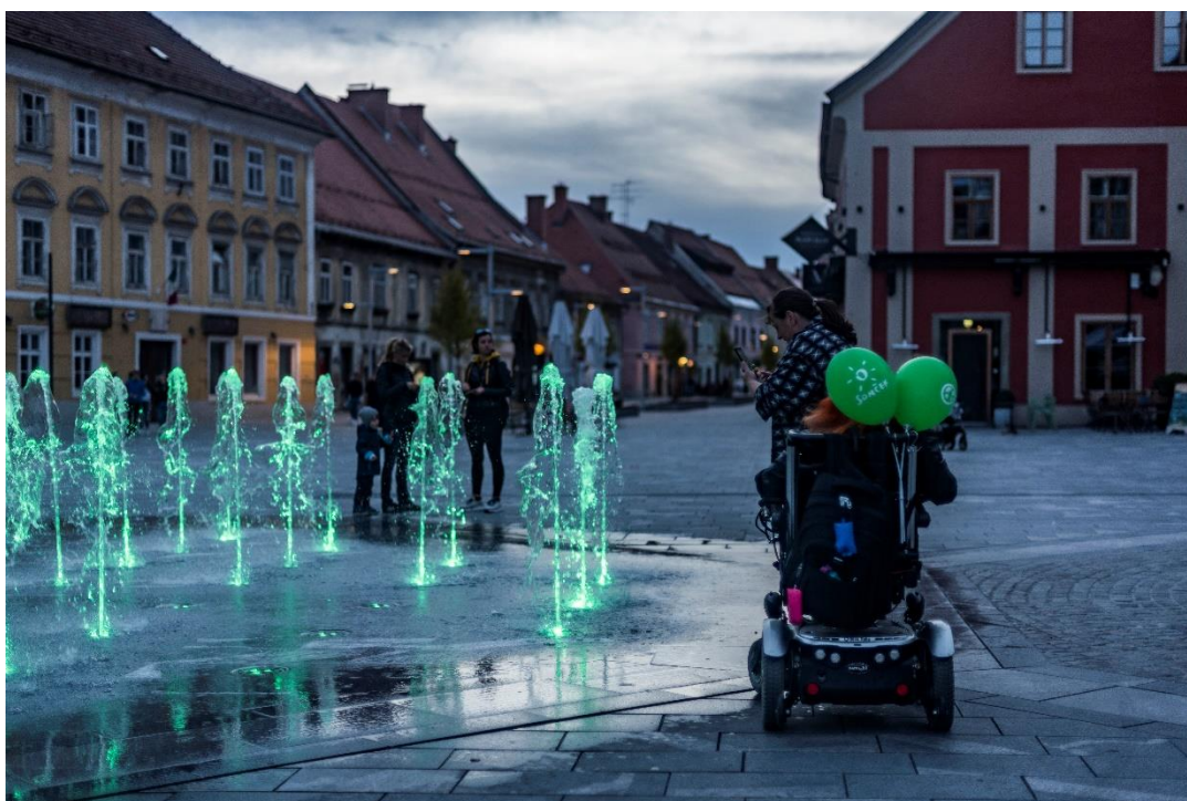
Na sliki: fontana na Glavnem trgu v Mariboru na dan 06.10.2020, obarvana v zeleno - barvo gibanja Svetovni dan cerebralne paralize.